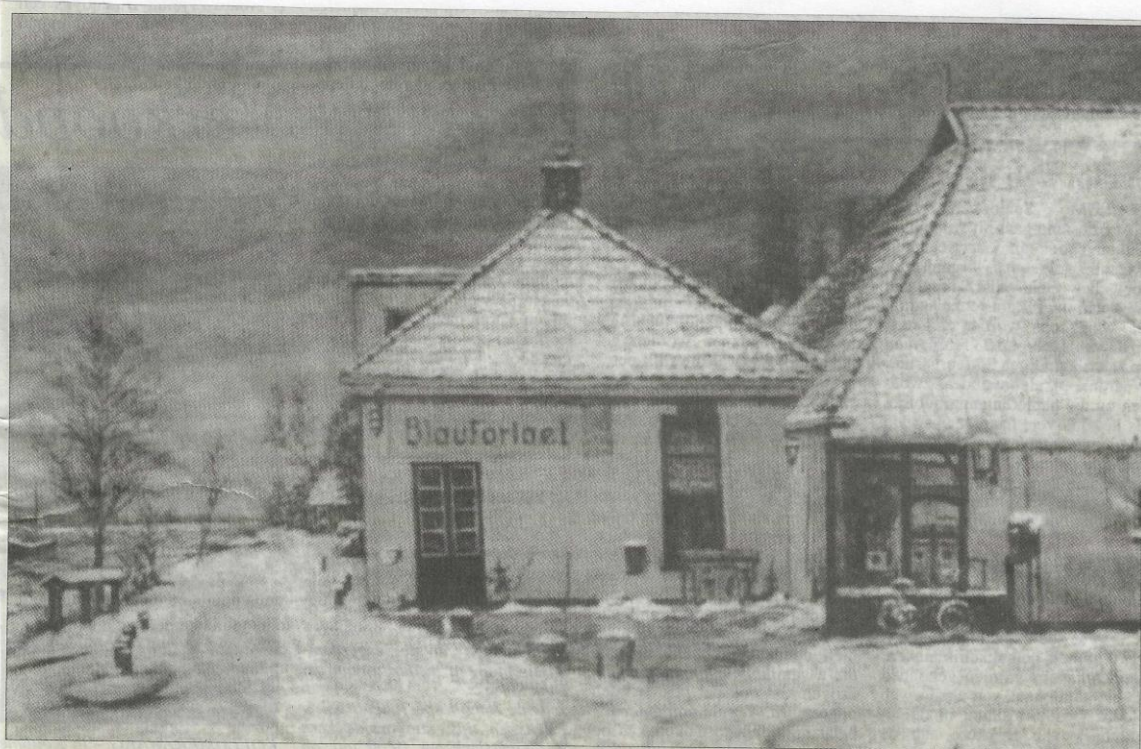
Het huidige pand Blauforlaet 2 te Augustinusga. (Tekening H. van der Bij)